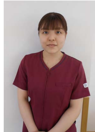
2022年入職 作業療法士