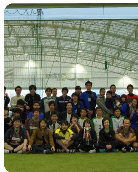
ゴルフ・フットサル